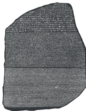
罗塞塔石碑 (收藏于伦敦大英博物馆)

从插图中我们可以看到： 埃及象形文字 就是在一块石头上刻着的一些符号。这些符号与在古埃及的方尖碑和法老墓中发现的符号是一样的。然而，这些符号包含信息吗？还是它们仅仅只是像墙纸一样的图案？一千四百多年来，人们一直未能找到这个问题的答案。直到1799年7月，当拿破仑的士兵在尼罗河三角洲港口城市罗塞塔附近发现了一块黑色的、如餐盘一般大小的玄武岩，情况才发生了根本性的改变。这块 罗塞塔石碑 ，在破译埃