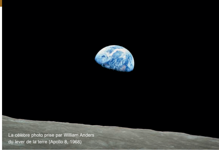
La célèbre photo prise par William Anders du lever de la terre (Apollo 8, 1968)

« L'immense solitude de la Lune, ici, est effrayante et nous fait comprendre ce que vous possédez véritablement sur la Terre. Vue d'ici, la Terre est une oasis grandiose dans le vaste