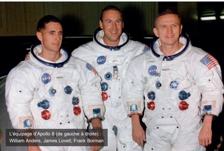
L'équipage d'Apollo 8 (de gauche à droite) : William Anders, James Lovell, Frank Borman