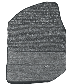
Rozetas akmens (pašlaik atrodas Britu muzejā, Londonā)

nozīme hieroglifu atšifrēšanā. Kad visa teksta nozīme bija kļuvusi zināma, radās pārlicība: hieroglifi satur informāciju.