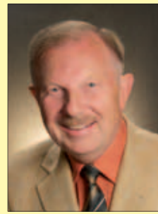
Բրոֆետոր Դոկտոր վերնր Գիտ

դրախտում Զեզ հետ լինեմ: Խնդրում եմ, փրկիր ինձ դժոխքից. մի վայր, որտեղ ես արժանի եմ քնալ իմ Բոլոր մեղքերի պատճառով: Դու ինձ այնքան շատ սիրեցիր, որ խաչի վրա մահացար իմ փոխարեն – իմ պատիժը Զո վրա վերցրիր: Դու տեսնում ես իմ Բոլոր մեղքերը՝ մանկությունից մինչև – հիմա: Դու քիտես իմ արած յուրաքանչյուր սխալը, հենց հիմա իմ ունեցած սխալ մտքերը – այն սխալները, որոնց մասին ես տեղյակ չեմ: Դու քիտես իմ սիրտը: Զո առջեվ, ես Բաց քրքի նման եմ: Ինչպիսի որ ես եմ, չեմ կարող դրախտ քնալ – լինել Զեզ հետ: Ես զոջում եմ – շատ եմ խնդրում, որ Դու ներես իմ մեղքերը: Արի իմ կյանքի մեջ – այն նոր դարձրու: Օքնիր ինձ չանել այն ամենը, ինչ ճիշտ չէ Զո առջեմ: Օքնիր ինձ, որ լավ սովորություններ ունենամ: Օքնիր ինձ, որ Զո հոսքը՝ Աստվածաշունչը, հասկանամ: Օքնիր ինձ հասկանալ, երբ խոսում ես ինձ հետ, – տուր ինձ խոնարհ սիրտ, որ կարողանամ Զո կամքը կատարել: Այս պահից սկսած իմ Տերը դարձիր: Ես ցանկանում եմ Զեզ հետեվի: Իմ կյանքի յուրաքանչյուր ասպարեզում ինձ ցույց տուր ճիշտ ճանապարհը: Շնորհակալություն, որ լսեցիր աղոթքս, որ ես Աստծո զավակ եմ – որ մի օր դրախտում Զեզ հետ եմ լինելու: Ամեն»: